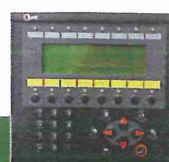
eenvoudig bedienbaar display met overzichtelijk beeldscherm