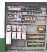
alle positioneer motoren frequentieregeld