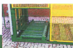
invoerrollerbaan voor uitvlakken van zakken