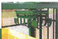
pneumatische bediende gripper