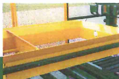
eenvoudig palletgrootte aanpassen